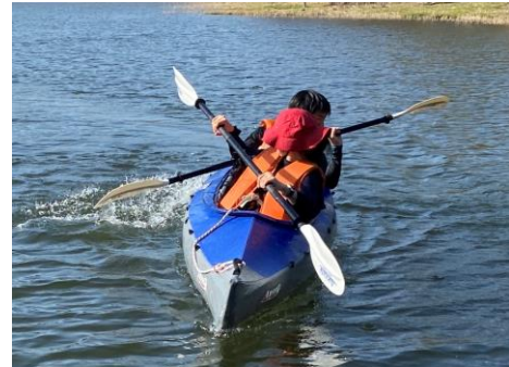
健康増進の取り組み