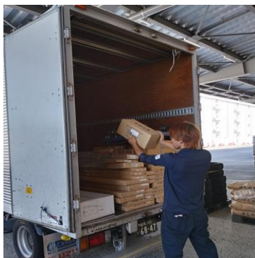
荷物の荷下し風景