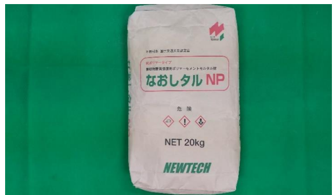
自社モルタル製品「なおしタル」