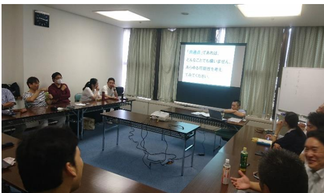
外部での社員研修の様子