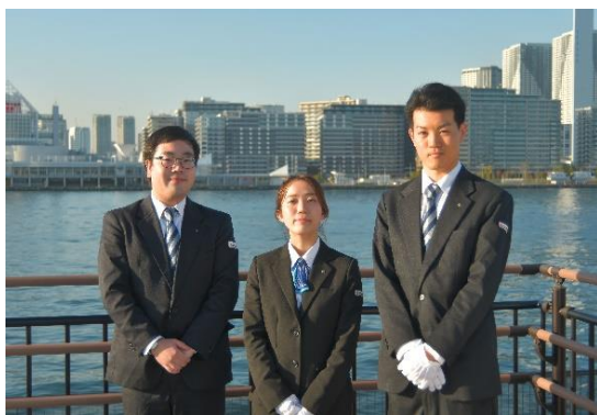
仲良く楽しい営業所です