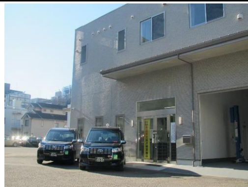
建て替えたばかりの営業所なので綺麗です!