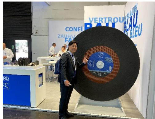
②戦前は巨大な戦艦を作る為の砥石が主でした。歴史は古い業界です。