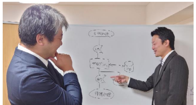
ミーティングの様子