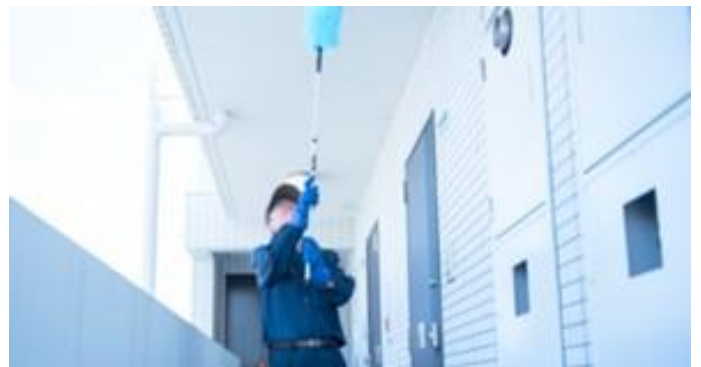
日常的な清掃作業