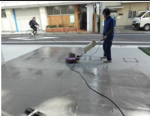
定期的な機械洗浄作業